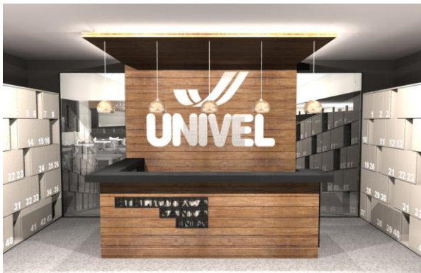
Figura 1. Entrada da Biblioteca, balcão de recepção e atendimento.

Quanto aos serviços oferecidos o objetivo da Biblioteca Inês Silva é de reunir, organizar e disseminar informações contidas em seu acervo, visando atender as pesquisas, consultas e estudos dos usuários nas áreas de atuação da Univel. Os usuários da Biblioteca Inês Silva contam com os seguintes serviços: atendimento ao usuário; consulta ao acervo; empréstimo domiciliar; renovação e reserva de materiais (presencial e online); catálogo on-line; comutação bibliográfica – COMUT; orientação individualizada ao usuário na busca de informações; auxílio na normalização de documentos e catalogação na fonte (ficha catalográfica). Além do acervo físico da biblioteca a UNIVEL também possui parceria com a Biblioteca Digital Saraiva.