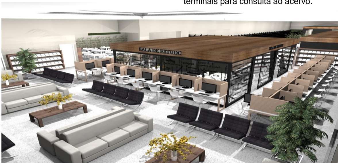
Figura 3. Vista de cima do ambiente de leitura, salas de estudos e terminais para consulta ao acervo.