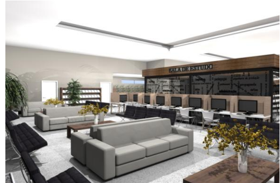
Figura 2. Ambiente para leitura na biblioteca com estofados, poltronas e terminais para consulta ao acervo.