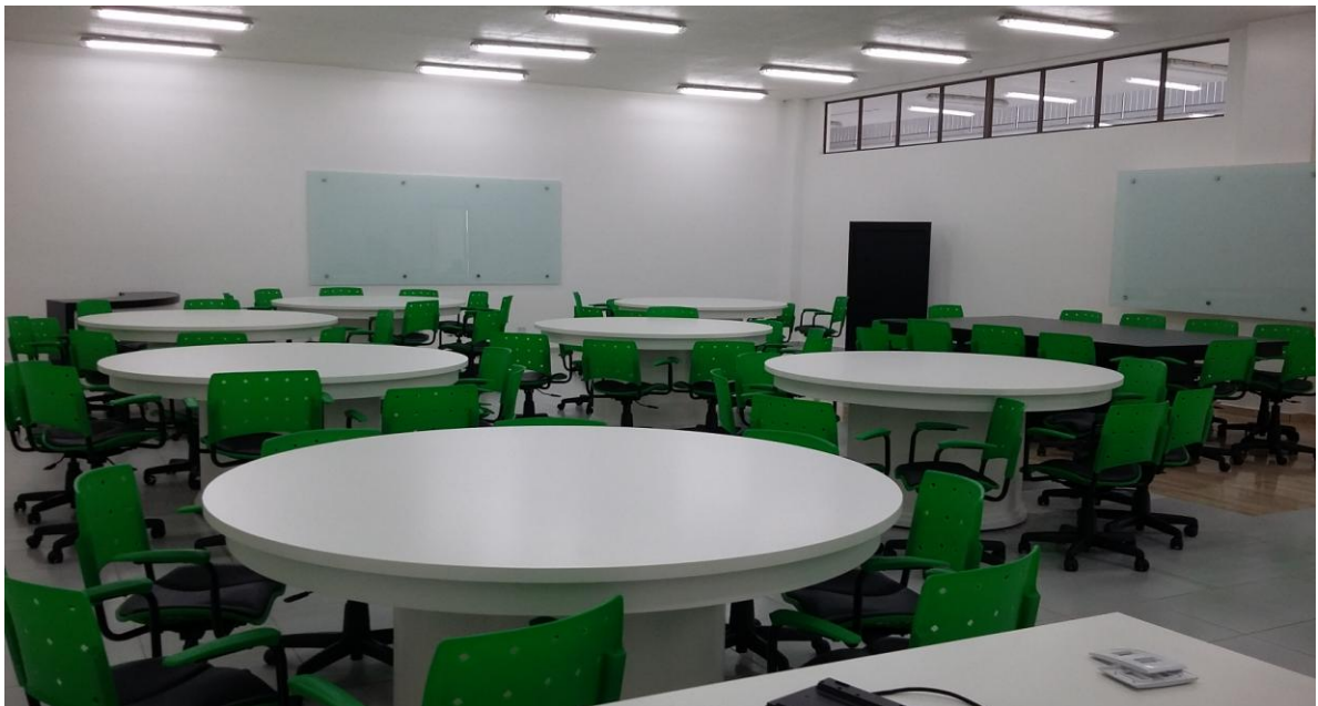
Figura 5. Sala de metodologias ativas para desenvolvimento de projetos interdisciplinares.

Os laboratórios de informática da IES estão adequados quanto à qualidade e infraestrutura, mas existe demanda da CPA quanto à quantidade e qualidade dos equipamentos. Em 2014 os laboratórios de informática tiveram uma boa avaliação nos quesitos cordialidade de atendimento, agilidade no atendimento, qualidade de acesso aos serviços, número de máquinas disponíveis. Porém, foi ressaltada a necessidade de melhoria de qualidade dos equipamentos. Em 2015 a avaliação por parte dos alunos e professores foi positiva em função de melhorias efetuadas pela IES. A UNIVEL constantemente está fazendo a atualização e no ano de 2015 foram