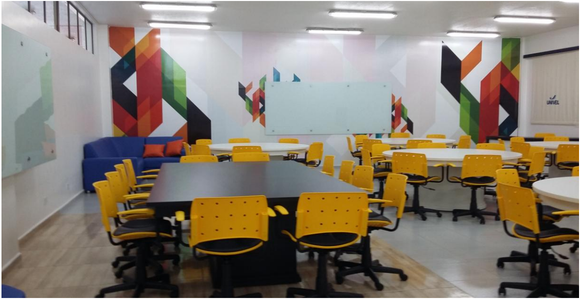
Figura 4. Sala de metodologias ativas para desenvolvimento de projetos interdisciplinares.